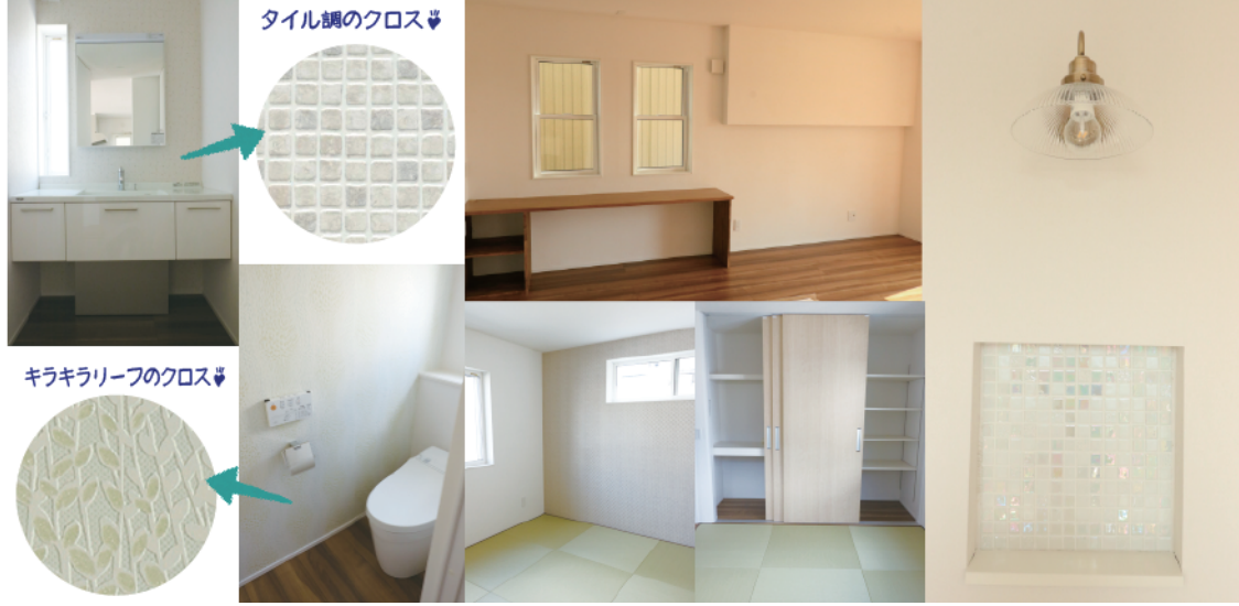
タイル調のクロス

途中で道がわからなくなったときは〇〇〇 FREE:0120-932-461 までお電話くださいね